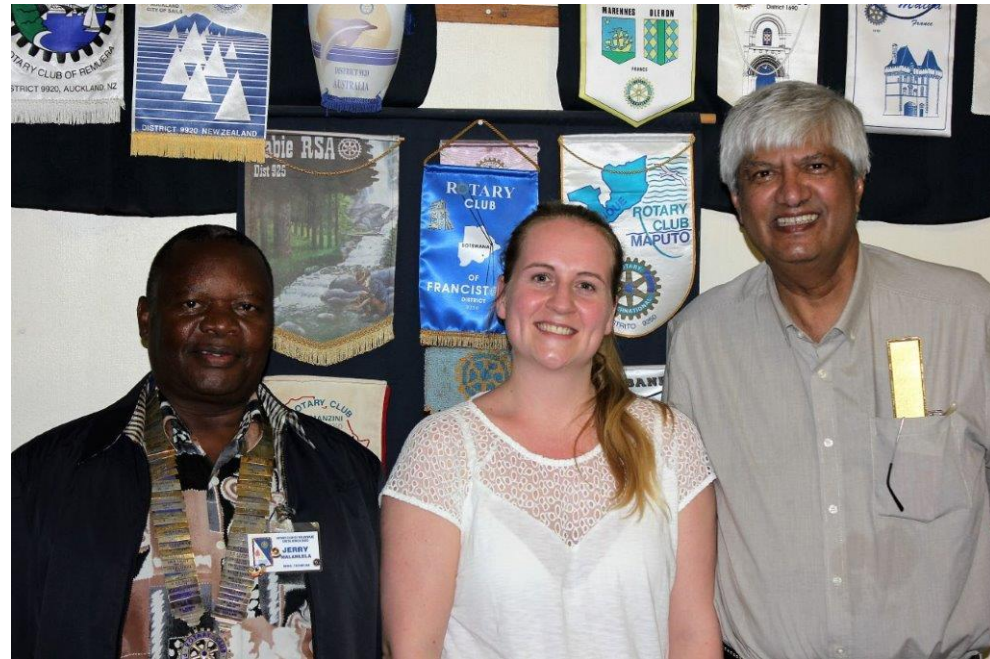
Rotarymøte og sosiale arrangement