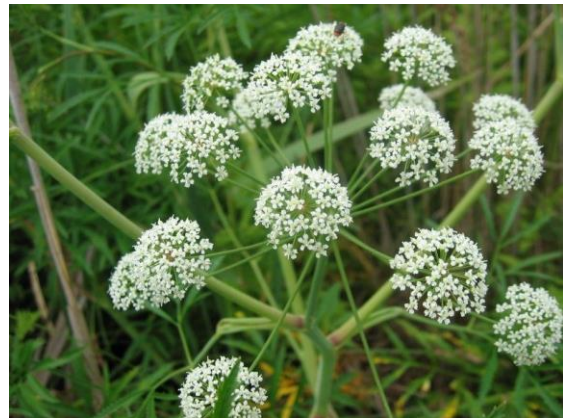
Revebjelle og selsnepe