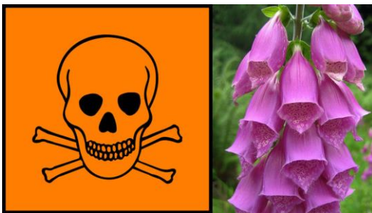
Giftige planter i Norge